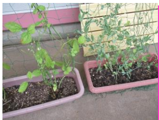
すずめ組 ・スナップエンドウ ・さやいんげん

保育園ですくすくと育った野菜たちです☆ 育った新鮮野菜は、給食でおいしくいただいています😊