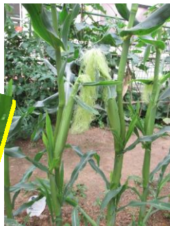
つばめ組 とうもろこし